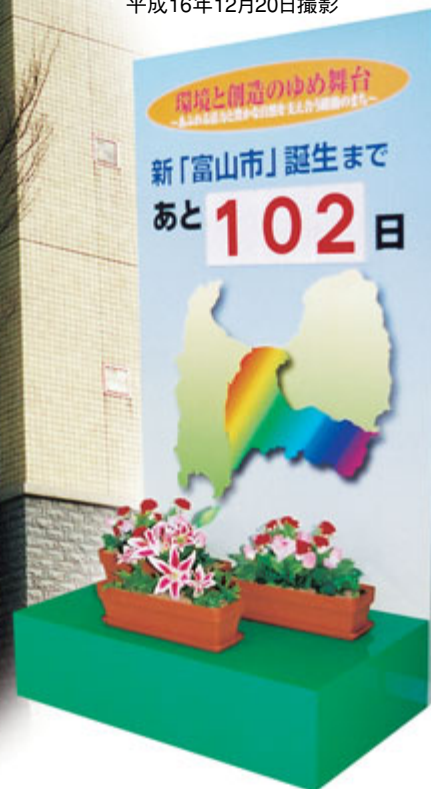
庁舎内に設置された カウントダウンボード(婦中町) 平成16年12月20日撮影