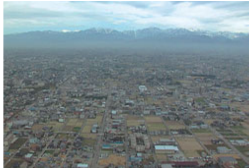
豊かな自然と高次都市機能は、新市の大きな魅力です