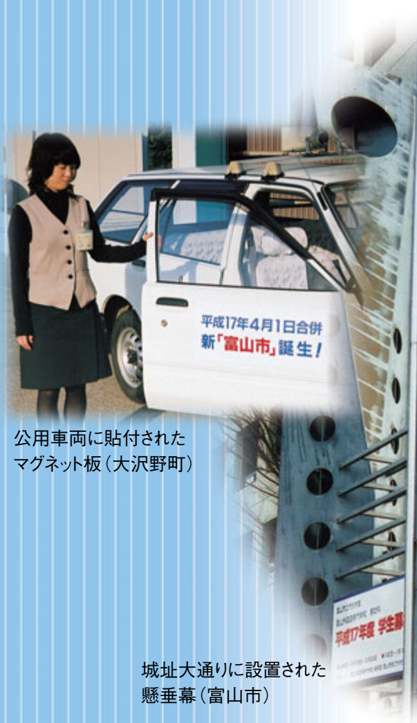
公用車両に貼付された マグネット板(大沢野町)