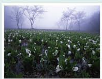
題名「霧雨に咲く」 作者/寺崎 章 (富山市)