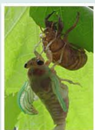
題名「あ〜きもちい」 作者/横山 雄也 (富山市)