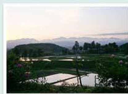
題名「五月の朝」 作者/竹田 一吉 (富山市)