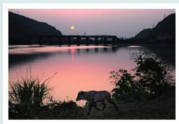
題名「夕陽 (ひ) に包まれて」 作者/猪谷 一郎 (富山市)