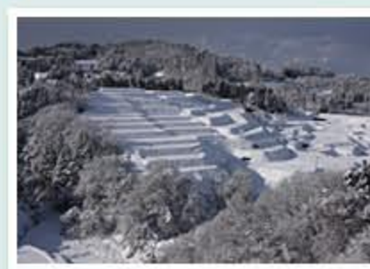
題名「白い森」 作者/高畑 訓 (富山市)