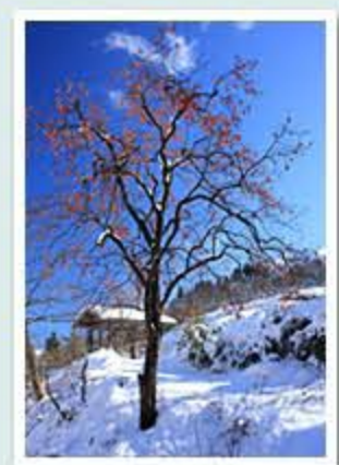
題名「残り柿のある風景」 作者/藤丸 正義 (富山市)