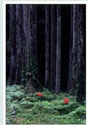
題名「美林のお彼岸」 作者/松田 正男 (射水市)