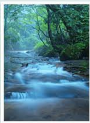
題名「霧の百間滑」 作者/水野 敬雄 (立山町)