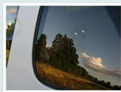
題名「車窓にうつるしゃぼん玉」 作者/畑 めぐみ (高岡市)