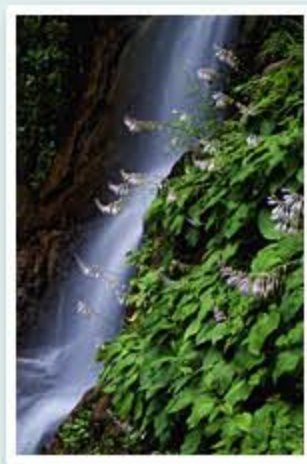
題名「涼風」 作者/木下 博貴 (愛知県)