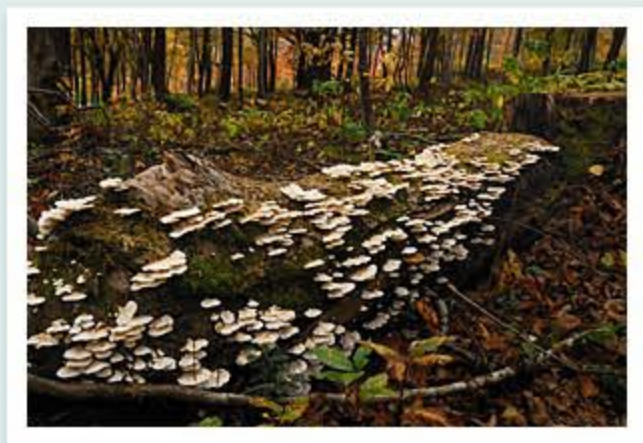
題名「朽ちても」 作者/大家庄 守 (滑川市)