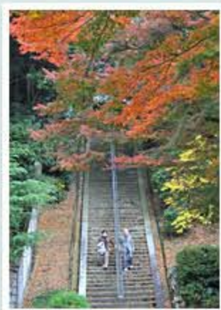
題名「楽しみな紅葉」 作者/吉岡 修 (富山市)