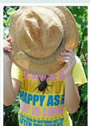
題名「イナイ・イナイ・バ〜」 作者/島田 伸洋 (砺波市)