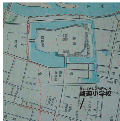
明治25年の市街図（部分）です。上の図と見比べてください。

砂を積んだ大八車の左右前後には「砂持」などと書かれた紅白の旗が翻っています。車輪の両端に結び付けられている長い縄には、7～8歳の子ども供たちが、一番の晴れ着を着てつながって歩いて、囃子の拍子に合わせて賑やかに市街を行ったり来たりしています。