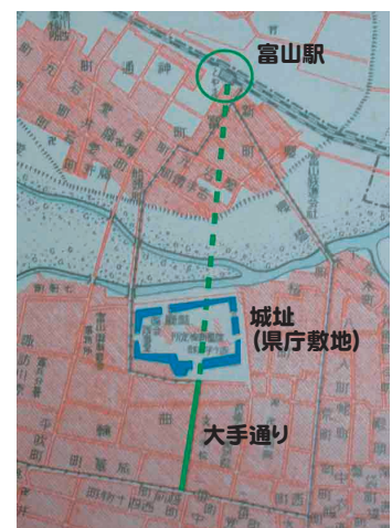
富山駅と大手通りを直線で結び、城址の中心を横切ります。

「富山城の遺構の一部が、市の発展のために破壊されたことは止むを得ないことである。しかし、これからは破壊の時代ではなく、史蹟保存の時代である。富山市発展の歴史を物語る唯一の遺構として、現在以上の破壊をすべきではないと信じる。」と述べているのです。このほか、「都市計画においては、経済的・物理的・社会的方面だけではなく、精神的文明や史蹟の保存に関しても注意しなければならない。」とも述べています。城址保存に対する思いが、言葉を変えつつ何度も繰り返されているのです。