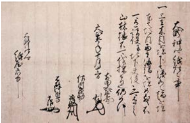
府中三人衆連署状（大滝神社蔵）