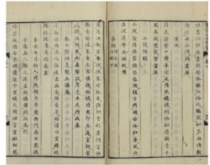
「寛齋遺業」巻一(当館蔵)

会期 令和2年11月21日(土)～令和3年1月31日(日) 休館日 12月16日(水)、12月28日(月)～1月4日(月) 開館時間 9:00～17:00(入館は16:30まで)