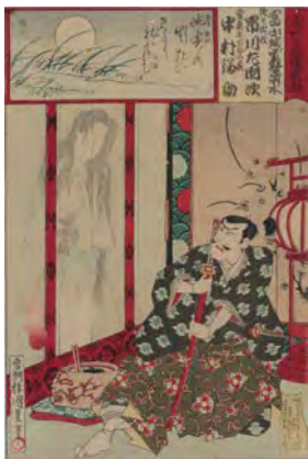
当狂言俳優腕競 富山城雪解清水 三代歌川国貞