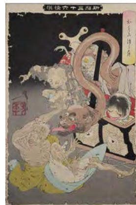
新形三十六怪撰 月岡芳年