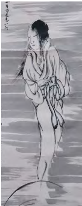
幽霊図 藤本鉄石(部分)