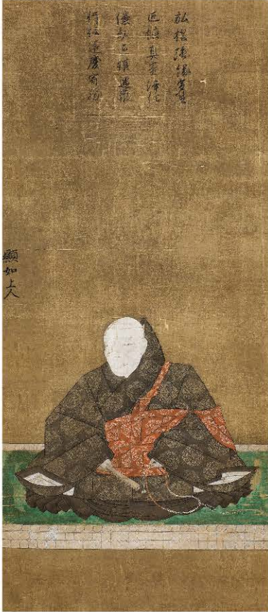
本願寺頭如像 (勝興寺蔵)