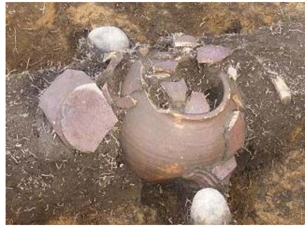
埋甕出土状況(江戸時代)