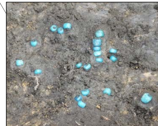
SZ10 埋葬施設 ガラス玉出土状況