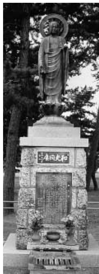
氷見市島尾海岸に漂着した富山空襲の犠牲者を供養するため、現地に建立された慰霊像

(注1)母からは海軍人事部と聞いていたような気がするが定かではない。大きな人体模型があったのを記憶している。診療所だったのかも知れない。近くにいた人で覚えていた人があたら教えて欲しい。