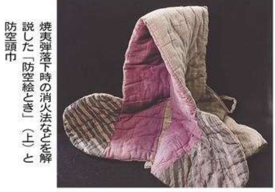
焼夷弾落下時の消火法などを解説した「防空絵とき」(上)と防空頭巾

HPではこのほか、空襲体験者へのインタビュー動画や被災した市街地の写真、当時の北日本新聞の記事などを見ることができ