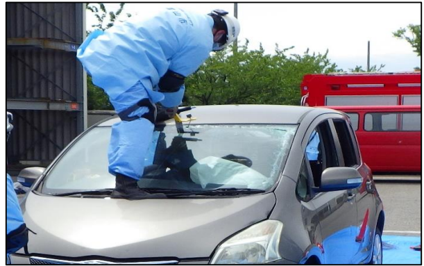
フロントガラス切断訓練