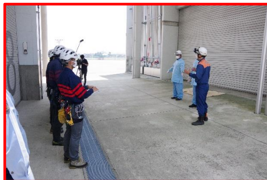
救急訓練（感染防止）