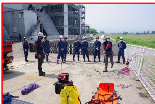
システム設定要領