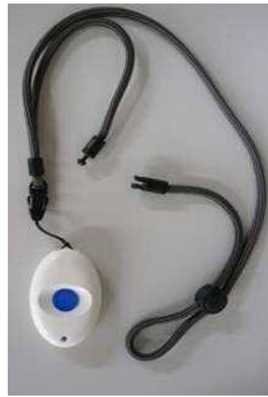
ペンダント型無線送信機