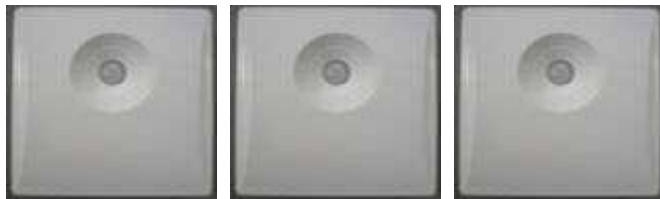
安否確認センサー (人感センサー)