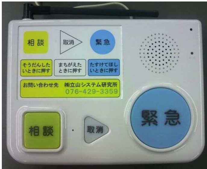
緊急通報装置 (本体)