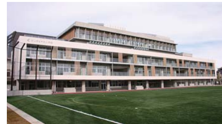
富山市立中央小学校