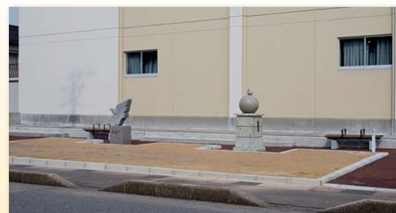
花壇 旧清水町小学校のモニュメントのある花壇