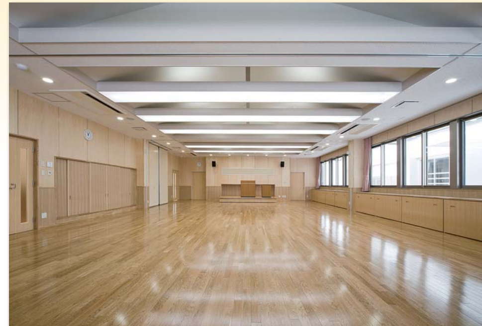
大会議室 大会議室は電動ステージ・ 電動スクリーン・音響設備 を備え、用途に応じて広さ も変更できます