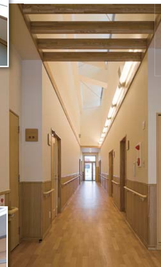
廊下 高窓のある明るい廊下