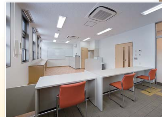
事務室 対応しやすいローカウンターで、ゆっくり座 って手続きが出来ます