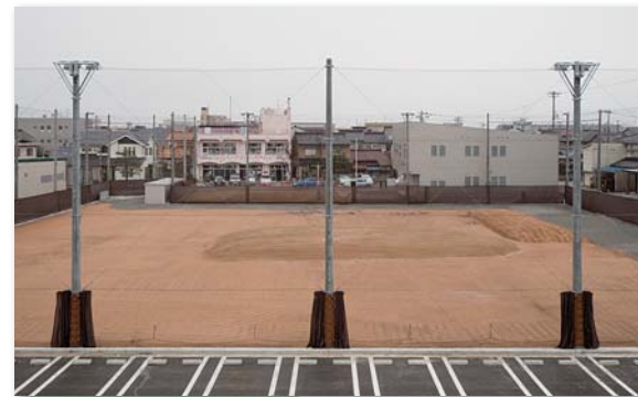
多目的広場 約120mのトラックを確保できる 多目的広場(2,600㎡) 夜間照明設備もあります