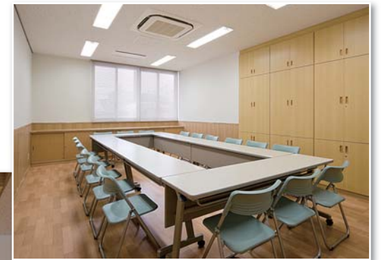
小会議室 少人数の打ち合わせ、会議等に利用 できます