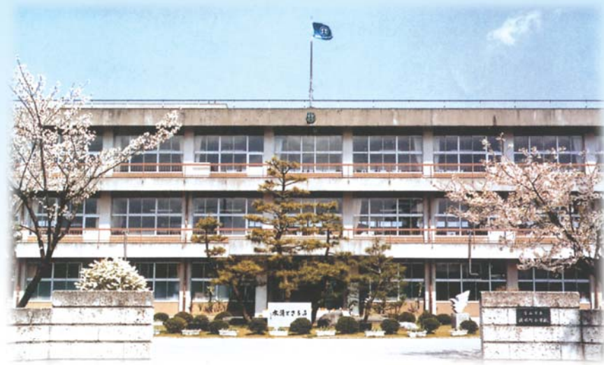
旧富山市立清水町小学校