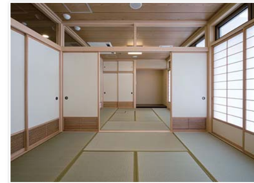
和室 水屋もあります お茶・舞踊・お花の練習もできます