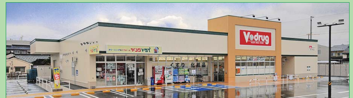
ドラッグストア(Vドラッグ)