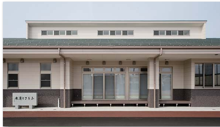
濡れ縁 周辺住宅と調和した勾配屋根 濡れ縁で休憩できます

鉄骨造 平屋建て (延べ床面積450,00㎡、建築面積553,76㎡) 駐車台数 38台