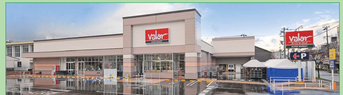
スーパーマーケット(パロー)