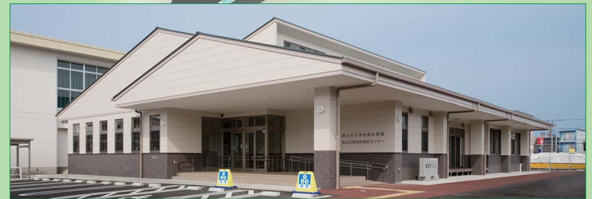
富山市立清水町公民館・富山市清水町地区センター