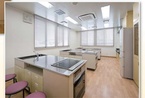
調理実習室 環境にやさしいIHクリーンヒーター調理台、 行事にガスコンロも併設しています