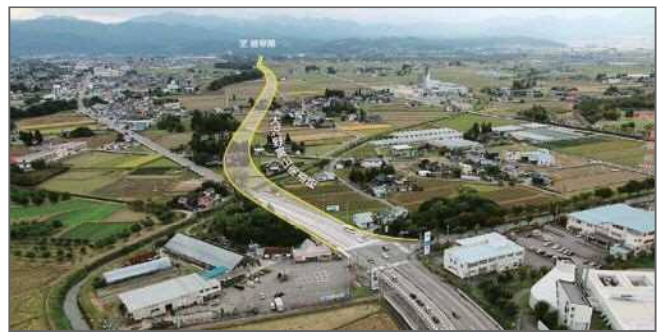
国道41号大沢野富山南道路イメージ (富山市栗山から岐阜方向を望む)