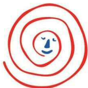
環境モデル都市富山 ECO-MODEL CITY TOYAMA