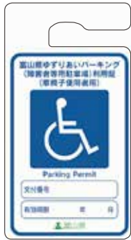
車いす使用者 (青色)