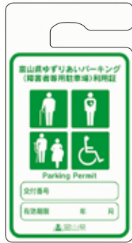
車いす使用者以外 (緑色)