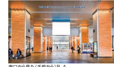
南口から見た(手前から)B、A