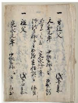
浅野家由緒書