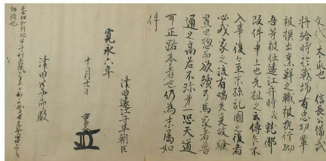
津田重久首数之覚 (当館蔵)

会期 令和5年2月11日(土・祝)～4月23日(日) 休館日 3月8日(水) 開館時間 9:00～17:00(入館は16:30まで)