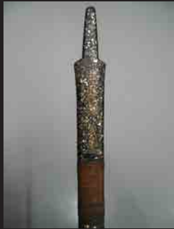
吉田大蔵青貝の弓 (当館蔵)

江戸時代の武士はサラリーマン化していたともいわれますが、展示からは、そのようなイメージとは異なる、古 いにしへ の武士と変わらない心根も見えてくるでしょう。「富山城とサムライたち」—富山城との関わりを通して、江戸時代のサムライのあり方を紹介します。