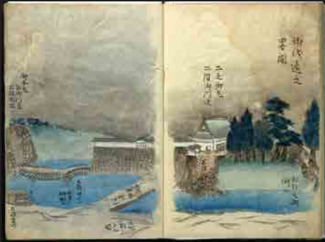
地水見聞録※