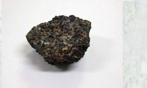
小出城跡出土 炭化したコメの塊 (富山市埋蔵文化財センター蔵)