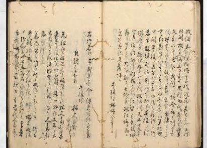
野崎祖先ヨリ由緒 (富山県立図書館蔵/前田文書)

会期 平成30年4月21日(土)～6月24日(日) 休館日 5月9日(水) 開館時間 9:00～17:00(入館は16:30まで)