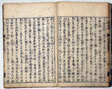
北国太平記 冊二 (当館蔵)

本展では、知られざる富山市内の戦国城館について、発掘調査で出土した遺物を中心に古文書も用いて紹介します。本展が戦国時代の富山へ思いを馳せるきっかけとなれば幸いです。