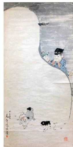
尾竹国親画「雪だるまと子供」 (個人蔵)

会期 平成27年12月5日(土)～平成28年2月14日(日) 休館日 12月21日(月)、12月28日(月)～1月4日(月) 開館時間 9:00～17:00(入館は16:30まで)