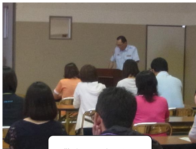
警防課長 あいさつ