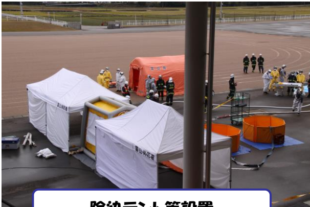
除染テント等設置