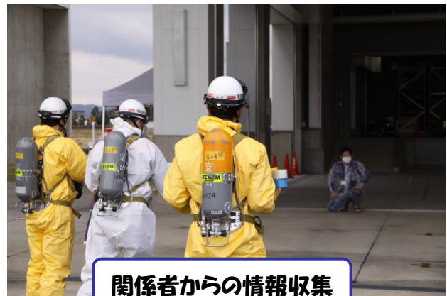
関係者からの情報収集