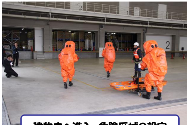
建物内へ進入、危険区域の設定