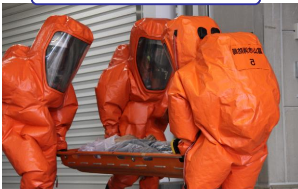
建物内(危険区域)で有毒物質の検知、傷病者の救出