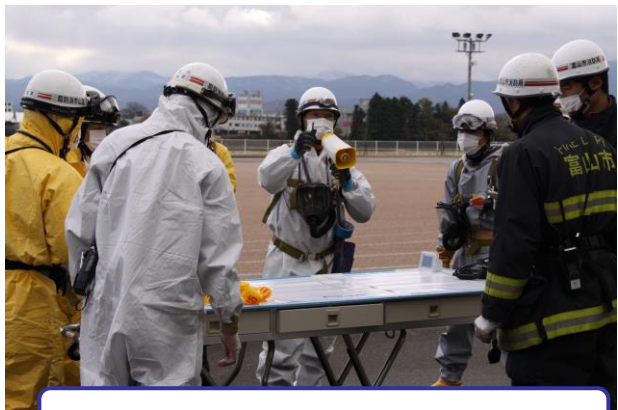
現場指揮本部設置、各隊へ活動指示