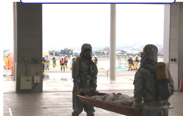
救出された傷病者を除染テントまで搬送