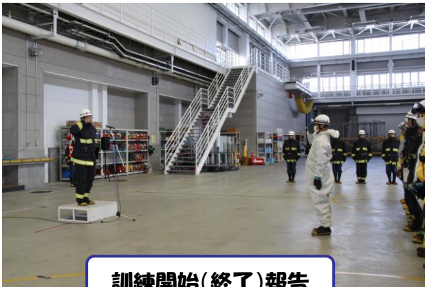
訓練開始(終了)報告

〇〇薬品工業(株)研究塔内で化学実験中に異臭が発生し、多数のものが体調不良を訴えたもの。