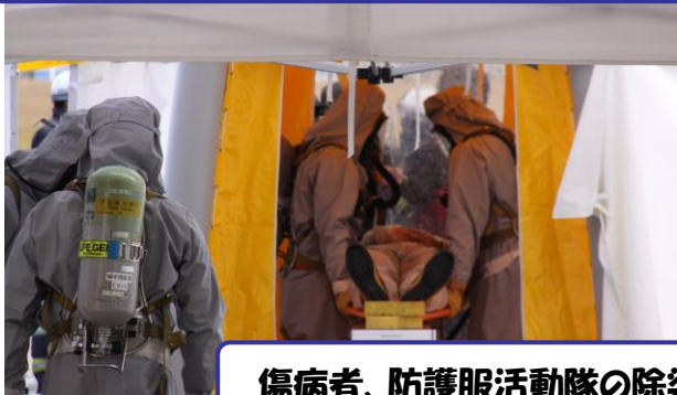
傷病者、防護服活動隊の除染活動(汚染物質の洗い流し)を実施