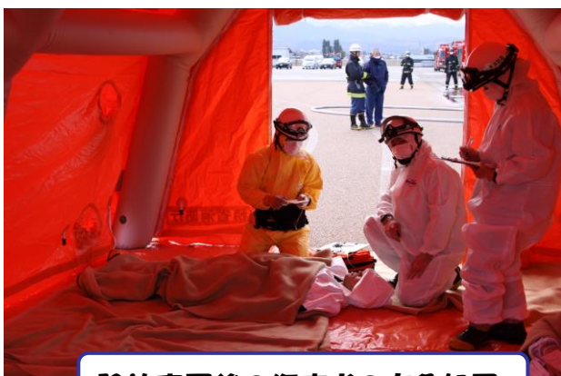
除染完了後の傷病者の応急処置