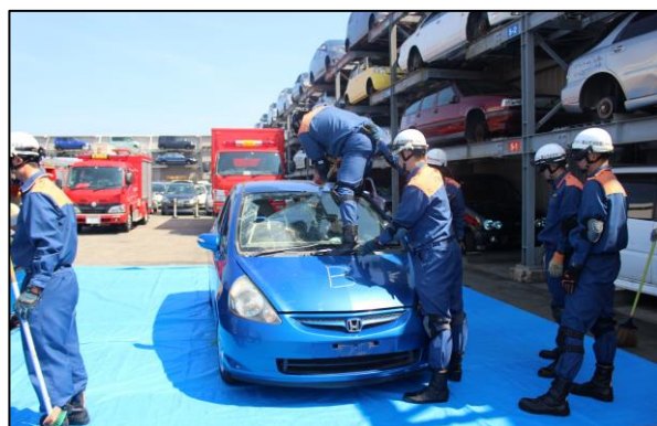
フロントガラス切断訓練