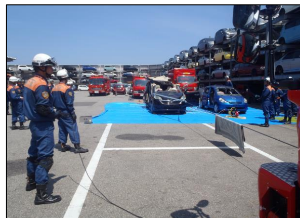
フロントウィンチ、可搬ウィンチ取扱訓練